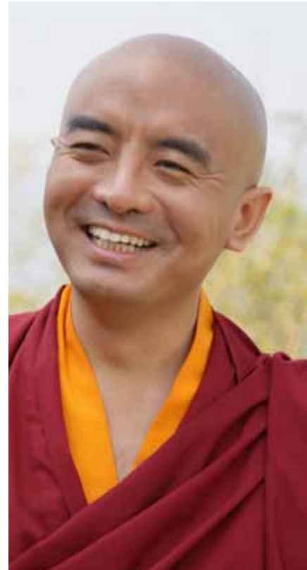
Yongey Mingyur Rinpoche

« Estamos creando esta visión juntos, y este año será un tiempo para que la comunidad entera comparta su sabiduría y experiencia colectiva. »