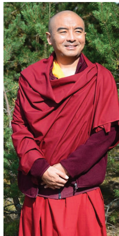
Yongey Mingyur Rinpoche

« Cuando establecemos una motivación cuidadosa en nuestra sesión de meditación, aprendemos a infundir todo lo que hacemos con compasión. »»