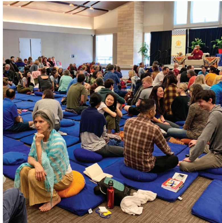
Mingyur Rinpoche ha añadido más elementos experienciales a sus propias enseñanzas, tales como las que este grupo pequeño comparte durante el retiro de 2019 de La Alegría de Vivir en Saint Paul, Minnesota.